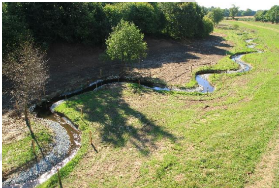
Reméandrage sur le territoire du SyBAMA