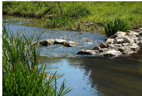
Site de Coupeau (Saint-Berthevin)

Les deux Contrats Territoriaux Eau 2020-2022 préparés entre le SyBAMA, le syndicat de bassin JAVO et l'agence de l'eau Loire-Bretagne, la Région des Pays de la Loire, associant le Département de la Mayenne, le SAGE et l'Etat, incluent la Communauté de Communes du Pays de Château-Gontier et la Fédération de la Mayenne pour la Pêche et la Protection du Milieu Aquatique également porteuses d'actions.