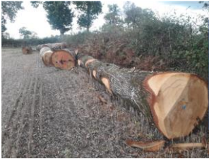
Contrôle des arrachages de haies

De nombreux signalements d'arrachage de haie sont parvenus vers l'OFB en 2020, notamment pendant la période du premier confinement. Le service départemental s'est déplacé de manière ciblée, pour vérifier les informations et apporter une réponse adaptée : procédure judiciaire OFB ou signalement auprès des services compétents (DDT pour l'urbanisme, les zonages Natura 2000 et les règles BCAA 7, DRAC en site inscrit, Gendarmerie pour les vols de bois ou dégradation de propriété).