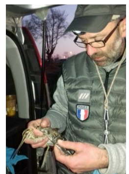
Opération bague bécassine