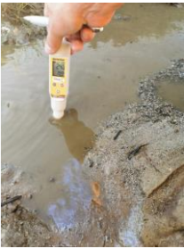
Contrôle pollution

L'OFB a été sollicité pour constater plusieurs cas de pollution chronique ou accidentelle au cours de l'année 2020, ayant généralement pour origine des établissements industriels ou des exploitations agricoles. Certaines d'entre elles ont fortement mobilisé le service, comme par exemple le déversement de 300 m 3 d'effluent agricole dans un ruisseau suite à une rupture du système de rétention. Ces opérations de contrôle ont parfois été menées avec le concours de la Gendarmerie ou de la DDCSPP (ICPE).