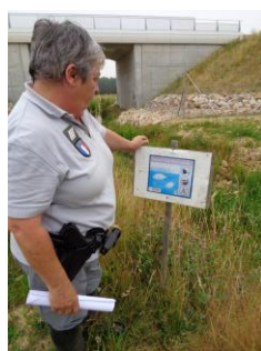
Contrôle travaux

Chef de service Olivier LEROYER Chef de service adjoint Denis LEROY