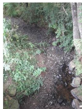
ONDE : Vicoin amont en assec