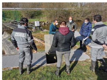
Suivi passe à poisson