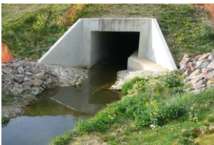
« Passage faune »

L'OFB a été sollicité par la DDT ou la DREAL pour donner un avis sur des projets d'aménagement. L'établissement est notamment attendu sur les questions de biodiversité (pertinence de l'état initial avant travaux), ainsi que sur les prévisions d'impacts (respect de la mise en œuvre de la séquence ERC, modalité de réalisation des travaux, contrôlabilité des arrêtés). Concrètement, l'analyse de l'OFB permet, par exemple, une meilleure prise en compte des milieux et des espèces : identification de zones humides, prise en compte du faucon pèlerin sur un dossier de demande d'extension d'une carrière, mise en place de dispositifs de continuité écologique au sein des aménagements (poissons, faune terrestre)..