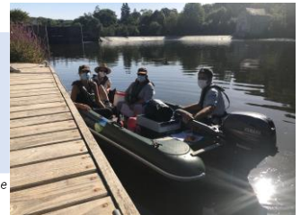
contrôle nautique sur la Mayenne

Deux opérations nautiques ont été conduites en coordination avec la DDT de la Mayenne, pour mettre à jour les connaissances des points de prélèvement dans la rivière La Mayenne.