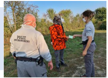
Contrôle des règles de sécurité à la chasse

Pour renforcer la sécurité à la chasse, de nouvelles règles de sécurité imposées par la loi du 24 juillet 2019 ont été inscrites dans le schéma départemental de gestion cynégétique (SDGC) : le port d'un gilet fluo pour la chasse collective du grand gibier, la pose de panneaux temporaires signalant des actions de chasse collectives en cours (grand gibier). Des dispositions complémentaires destinées à garantir la sécurité des chasseurs et des tiers ont également été instaurées : respect de l'angle des 30°, usage des armes sur les voies ouvertes au public, interdiction de chasser avec une arme équipée d'une bretelle... ont fait l'objet de plusieurs opérations de contrôle.