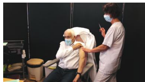
Vaccination au centre de vaccination de Laval.

Dans ce contexte, le dispositif de vaccination s'est déployé sur le territoire dans une coordination étroite de la préfecture et de l'ARS. Ainsi, 8 centres ont été mis en place par les professionnels de santé avec l'appui des collectivités territoriales qui se sont impliquées avec la mise à disposition de locaux et en assurant la gestion administrative des centres.