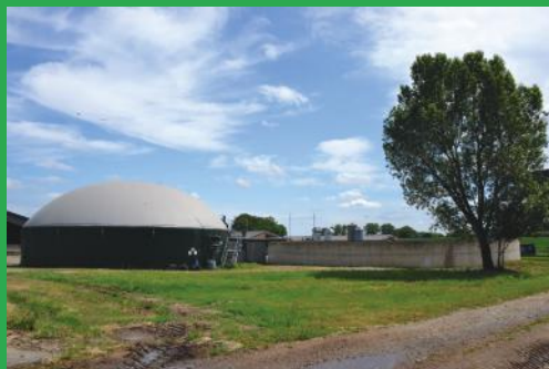
Site de méthanisation du GAEC de l'Épine à Saint-Berthevin.