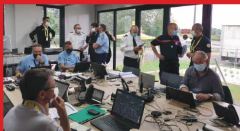
Le préfet au poste de commandement sécurité du tour de France.

Ce grand rassemblement festif et populaire a nécessité une importante mobilisation des services de l'État et des forces de sécurité en amont et le jour de l'épreuve.