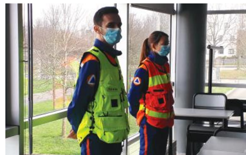
Médiateurs Lutte anti-Covid de l'ADPC.

Parallèlement, les médiateurs de lutte anti-Covid (LAC) mobilisés en Mayenne par l'association départementale de protection civile (ADPC) ont été missionnés pour porter des actions de prévention ou compléter l'offre de dépistage sur les territoires très touchés par la vague épidémique.