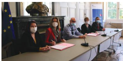
Signature de la convention de collaboration entre la préfecture, l'ARS, le Parquet, les forces de l'ordre et les centres hospitaliers.

► Réunion du comité local d'aide aux victimes (CLAV) dédiée aux violences faites aux femmes le 22 novembre 2021.