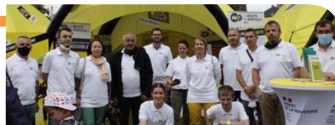
Equipe DDT et IDSR